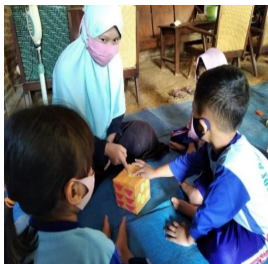
Gambar 3. Pendidik menjelaskan cara bermain dadu geometri