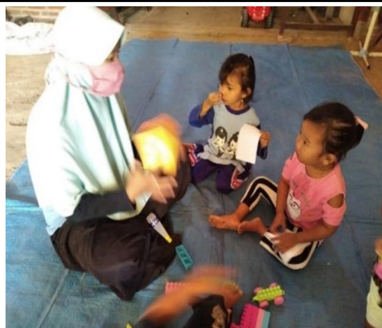
Gambar 2. Pendidik Menjelaskan Kepada Anak Tentang Dadu Geometri

Dapat disimpulkan dari tabel diatas kemampuan mengenal bentuk geometri meningkat. Yang mana dari 3 anak menjadi 6 anak dan berakhir dengan 11 anak yang tuntas. Sedangkan data ketuntasan kelas dari kondisi awal hanya 25 % yang dikatakan kelas belum tuntas, pada siklus I meningkat menjadi 50% tetapi masih dalam kondisi belum tuntas. Dilanjutkan ke siklus II meningkat menjadi 92% itu berarti ketuntasan kelas sudah mencapai standar keberhasilan.