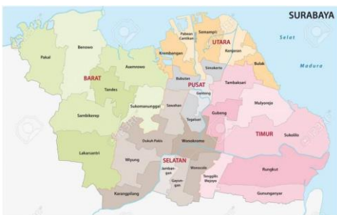
Gambar 1 Peta Surabaya [10]

Penelitian ini dilaksanakan pada tanggal 1-30 Desember 2023. Pengambilan sampel dilakukan di Pesisir Pantai Kenjeran Surabaya dengan metode eksplorasi dan observasi sebagai metode dalam langkah mengidentifikasi suatu jenis hewan invertebrata. Adapun alat, bahan dan prosedur kerja yang diperlukan selama penelitian sebagai berikut: Alat yaitu Sarung tangan, Toples, Penggaris dan Pinset. Sedangkan prosedur kerja sebagai berikut: Mengambil sampel, yaitu hewan moluska yang diambil di Pesisir Pantai Kenjeran Surabaya, membersihkan dan mengukur panjang sampel dengan penggaris, menggambar struktur tubuh dan membuat deskripsi dari masing-masing sampel, dan menulis klasifikasi dari masing-masing sampel secara lengkap.[9] Teknik analisis data yang digunakan dalam penelitian ini adalah teknik analisis deskriptif, yaitu mendeskripsikan ciri-ciri morfologi setiap hewan invertebrata yang ditemukan di Pesisir Pantai Kenjeran Surabaya (Gambar 1). Data spesies yang ditemukan dan dikumpulkan diidentifikasi dan diklasifikasikan berdasarkan karakteristik morfologi menggunakan referensi literatur dari berbagai jurnal, artikel, dan situs web di Internet. Hasil identifikasi dirangkum berdasarkan nama ilmiah, nama daerah, dan genus.