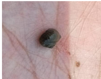
Gambar 5. Pomacea canaliculata (Siput / Murbai/Keong Mas)

Klasifikasi Ilmiah spesies ini dimulai dari kingdom: Animalia, filum: Moluska, kelas: Gastropoda, ordo: Neogastropoda, famili: Muriciadae, genus: Eupleura dan spesiesnya adalah Eupleura caudata (Gambar 5). Berdasarkan hasil pengamatan bahwa Eupleura caudata memiliki bentuk cangkang yang sangat besar dan dikenal sebagai predator. Cangkangnya juga kokoh serta tebal, memiliki 5 lingkaran yang berputar ke kanan (dekstral) bersudut tajam dengan tulang rusuk berduri. Putaran pada cangkok tersebut berasal dari apeks melalui whorl hingga ke aperture serta pada bagian tengah terdapat sumbu putaran yang dinamakan kolumella yang tidak terlihat dari luar. Jika dilihat dari atas cangkangnya tampak lonjong, memiliki warna coklat kemerahan yang sangat cantik [14]