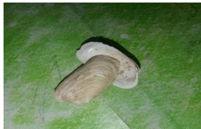
Gambar 4. Hiatella arctica

Klasifikasi Ilmiah spesies ini dimulai dari kingdom: Animalia, filum: Moluska, kelas: Gastropoda, ordo: Neogastropoda, famili: Muricidae, genus: Bolinus dan spesiesnya Bolinus Brandaris (Gambar 3). Berdasarkan hasil pengamatan yang telah dilakukan bahwa siput laut atau yang kerap dikenal sebagai murex pewarna ungu ini memiliki cangkang yang berduri tajam. Bolinus brandaris memiliki bentuk cangkang yang mirip dengan gadah. Spesies ini seringkali ditemukan dengan warna putih tulang. Ada pula yang berwarna krem hingga kecoklatan. Ukuran cangkang dewasa Bolinus brandaris bisa mencapai sekitar 60 hingga 90 mm. Cangkang biasanya dilengkapi dengan kanal siphonal yang sangat panjang dan lingkaran tubuh bulat dengan puncak menara rendah.