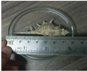
Gambar 1. Siput Laut ( Bolinus brandaris )

Moluska merupakan kelompok hewan invertebrata yang lunak dengan tingkat keragaman yang tinggi, biasanya sering dijumpai pada ekosistem terumbu karang, padang lamun, dan mangrove [11]. Moluska yang dimanfaatkan oleh masyarakat lokal sebagai salah satu sumber protein bagi masyarakat pesisir pantai kenjeran Surabaya. Hewan-hewan moluska ini memiliki ciri yang hampir sama, yakni memiliki cangkang atau cangkok. Hewan invertebrata pada Kelas Amphineura hidup di dasar laut, memiliki tubuh pipih, cangkang, dan sistem reproduksi seksual dengan fertilisasi eksternal. Gastropoda, sebagian besar berupa siput, memiliki sistem pencernaan sempurna, bernapas dengan paru-paru atau insang, dan umumnya bersifat hermafrodit. Kelas Scaphopoda memiliki cangkang tajam berbentuk terompet, hidup di dalam pasir/lumpur, dan bersifat gonokoristik. Cephalopoda, seperti cumi-cumi dan gurita, memiliki tubuh tanpa cangkang, kepala, kaki, dan sistem reproduksi seksual dengan fertilisasi eksternal dan kelas Pelecypoda, atau kerang-kerangan, memiliki tubuh pipih dengan dua belahan cangkang, hidup di pasir/lumpur, dan bersifat hermafrodit. Berdasarkan hasil pengamatan yang telah dilakukan inventarisasi hewan dari filum moluska yang ada di daerah Pesisir Panta Kenjeran Surabaya diperoleh sebagai berikut: