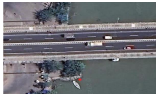
Gambar 2. Titik Pengambilan sampel [10]