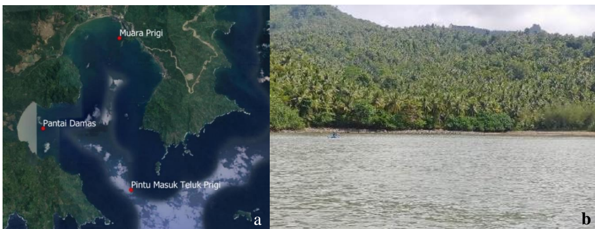
Gambar 1. Lokasi Penelitian. a) Letak Pantai Damas pada Wilayah Perairan Teluk Prigi, b) Lokasi Pengambilan Sampel

Penelitian dilaksanakan di wilayah Pantai Damas wilayah Teluk Prigi dengan titik koordinat 08°19'57.8" LS 111°41'57.7" BT seperti ditunjukkan dalam gambar 1. Peta wilayah dibuat dengan menggunakan software komputer QGIS versi 3.10. Pantai Damas merupakan salah satu bagian dari kawasan Teluk Prigi yang masih aktif dijadikan sebagai wisata, dimana letaknya menjorok dan berbentuk seperti cekungan. Analisis mikroplastik diambil dari saluran pencernaan ikan tongkol lisong hasil tangkapan di pantai Damas. Jenis polimer mikroplastik dianalisis dari hasil uji FITR ( Fourier Transform Infrared ).