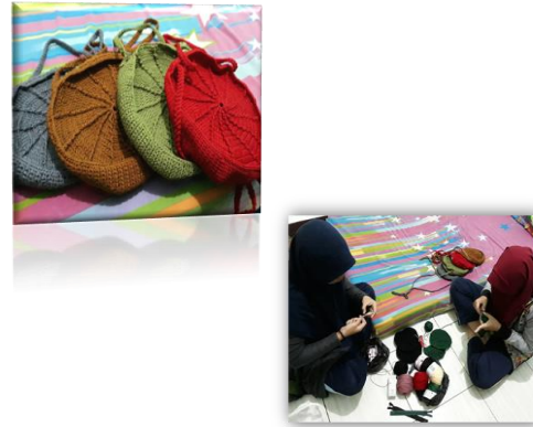
Gambar 2. Kreativitas mahasiswa membuat Kerajinan Tas

Nilai kewirausahaan yang kedua yang terinternalisasi melalui kegiatan pembelajaran adalah Kreatif dan Inovatif . Tuntutan pembelajaran untuk menghasilkan suatu produk inovatif mengharuskan mahasiswa berpikir keras dalam mencapainya. Mahasiswa diberi kebebasan untuk berkreasi secara inovatif menciptakan produk usaha sebagai tugas dalam kegiatan pembelajaran kewirausahaan. Ide-ide kreatif dan inovasi masa depan banyak bermunculan dari hasil pemikiran mahasiswa sebagaimana diwujudkan dalam kegiatan pembelajaran yang dilakukan, misalnya kreatifitas mahasiswa dalam menciptakan bahan kerajinan, kuliner, sebuah platform (aplikasi) berbasis android. Gambar berikut ini adalah contoh kegiatan inovatif dari mahasiswa dalam menciptakan bahan kerajinan tas dari benang.