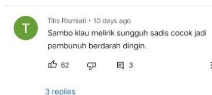
Gambar 4. Ayah Brigadir J minta Ferdi Sambo dan Putri Candrawati buka masker #shorts