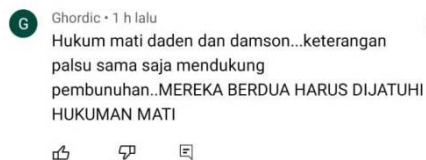
Gambar 2. Pernyataan saksi yang menyita perhatian.