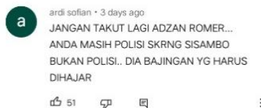
Gambar 6. Romer Ungkap Rasa Takut Dengan Ferdi Sambo Untuk Memberikan Kejujuran #Shorts